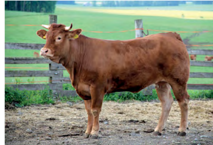
Ranskalaisesta tuontialkiosta syntynyt Metsä-Paavolan Fillevi on ahkera alkiontuottaja: tähän mennessä siltä on saatu jo 36 siirtokelpoista alkioita!

Sersialta suositeltiin isäsonniksi Fillevin toiseen huuhteluun Urvillea, jota löytyi vielä muutama annos Faban varastolta.