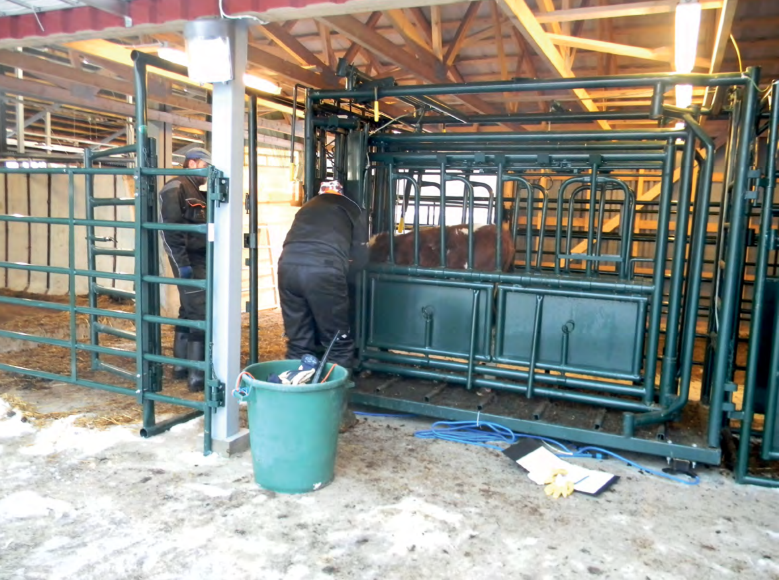
Käsittelyhäkissä on helppoa ja turvallista hoitaa eläimiä