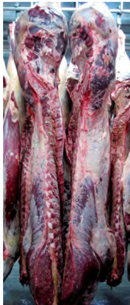
Kuvista on nähtävissä, kuinka lihaisaa E-ruho on. Luokitus E 2 ruhopaino 469 kg. Eläin Jarkko Kääriälän karjasta.

Liukokset sanovat vaatimattomasti, että ei kunnia oikeastaan heille kuulu, vaan erinomaisia luokitustuloksia periyttävälle sonnille. Liukokset myyvät vasikoita myös vierotettuna teuraskas-